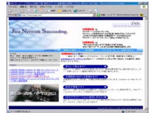
正規の ホームページ