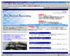
正規の ホームページ

Webエイドは、Webの改ざんを検知し、管理者に報告、必要に応じて自動的に復旧する製品です。本製品は、従来製品とは異なり、Webサーバにアプリケーションを搭載しません。その結果、安全性、運用性、利便性に優位性が生まれました。