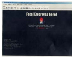
改ざんされた ホームページ