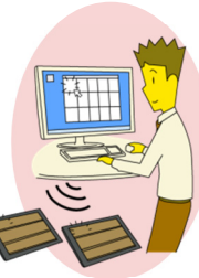
サーバ側のワンタッチ操作で資料の廃棄が完了