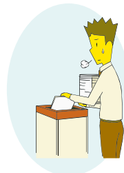
資料回収や廃棄の工数コストがかかる