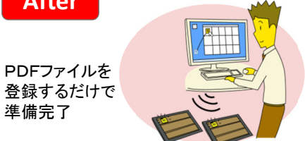
PDFファイルを登録するだけで準備完了