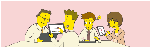
資料を手元で見やすい 発表者の資料操作に合わせてページ同期