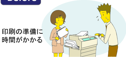
印刷の準備に時間がかかる